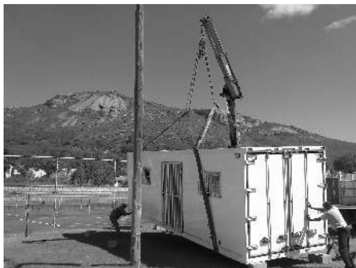
Die mediese fasiliteit word op sy plek gesit agter Noorde-kant van die A-veld